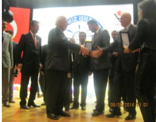
Milli Eğitim Bakanımız Nabi Avcı, Okul Müdürümüz Tuncay Ercan'a ödülünü verirken

2013-2014 Eğitim Öğretim yılında ilimiz okulları BBE yarışmasına 157 proje başvurusu yapmıştı.